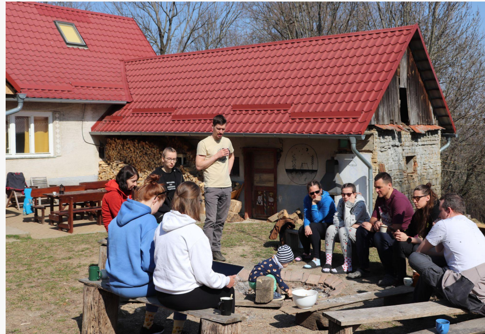
Fotky z Valného zhromaždenia, marec 2022