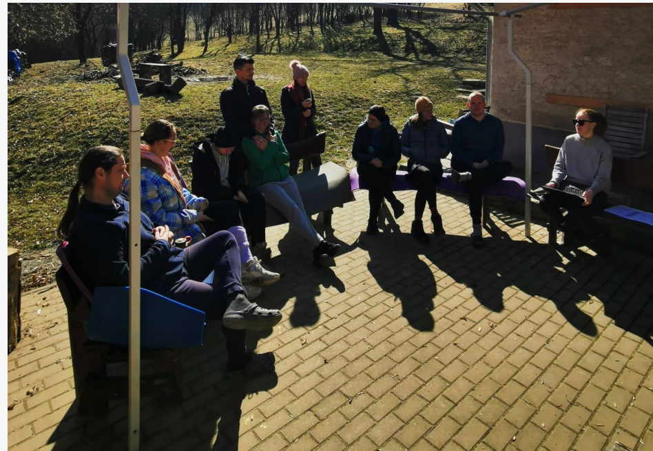
Fotky z Valného zhromaždenia, marec 2023